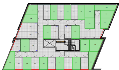
L3 - Mesanin