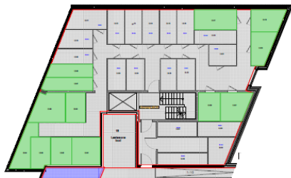
L3 - 1. etasje

Boder markert med grønn farge, eies og disponeres av utbygger Jessheim Byutvikling As, jfr vedtektenes § 3-2-2