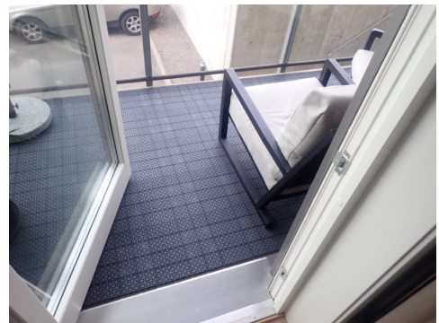
Balkong ut for soverom

Terrasse ut for stue/kjøkken bygget på bakkenivå. Gulv av impregnerte behandlede terrassebord. Rekkverk i stål og glass. Rekkverk er montert av eier etter byggeår.