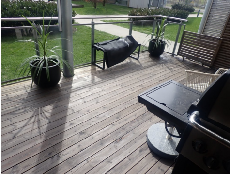
Terrasse ut for stue