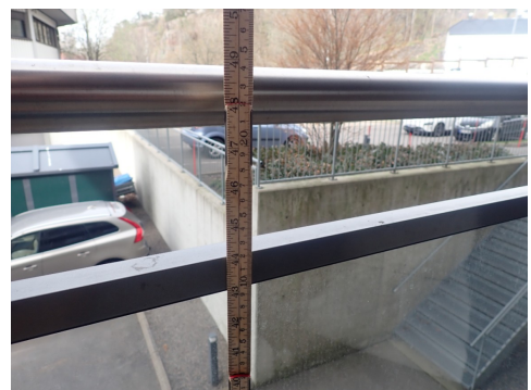
Høyde rekkverk er OK