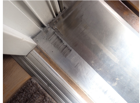
Balkongdør subber mot terskel