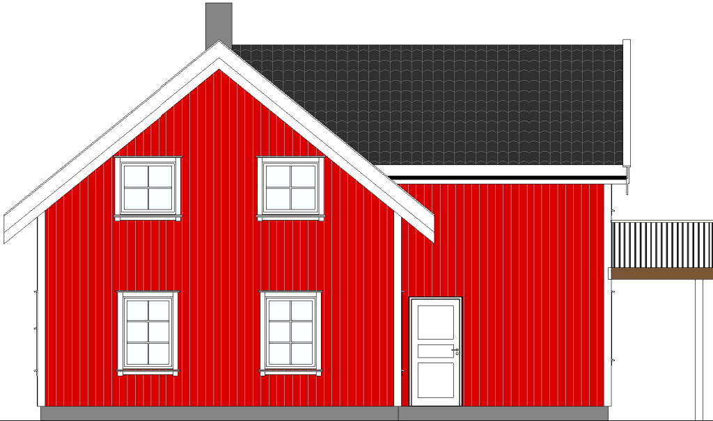
Fasade Øst 1 : 100