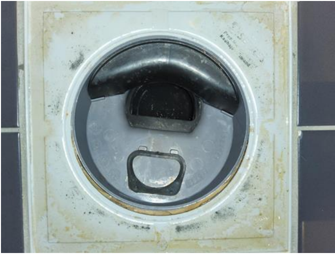
Membran, tettesjikt og overgang til sluk. - [Sluk på baderom ]