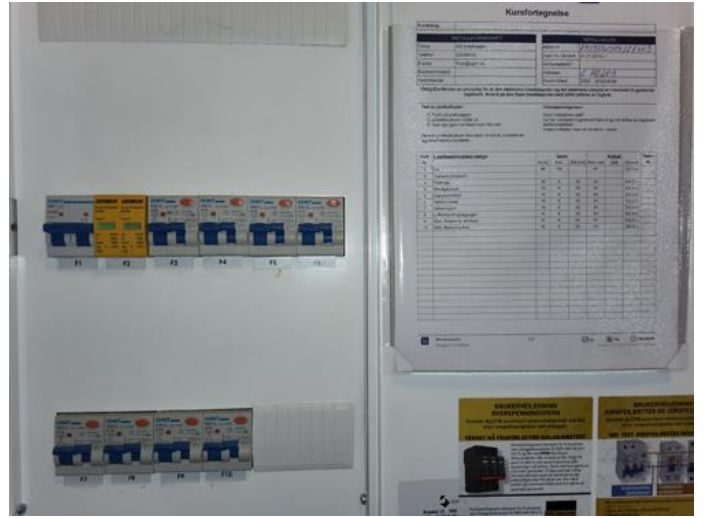
Elektrisk anlegg - [Sikringsskap ]