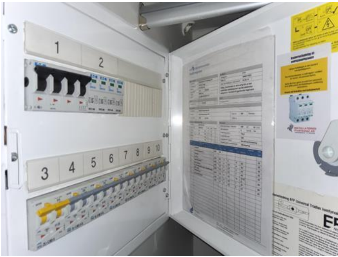
Beskrivelse - [Sikringskap med kursfortegnelse.]