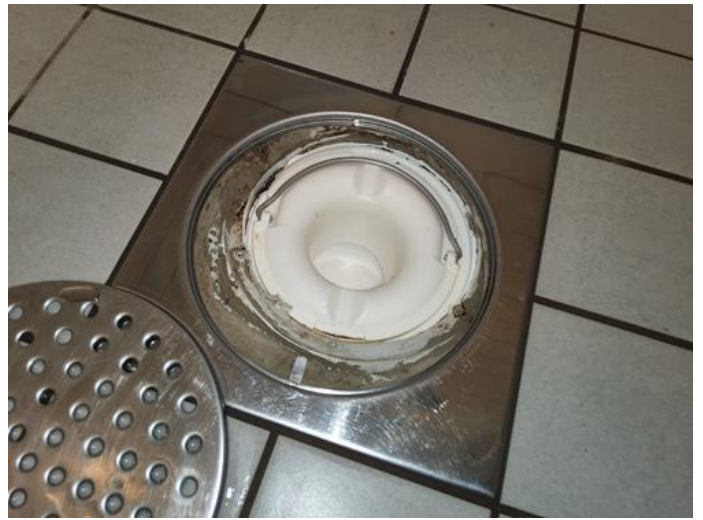
Membran, tettesjikt og overgang til sluk. - [Sluk bad.]