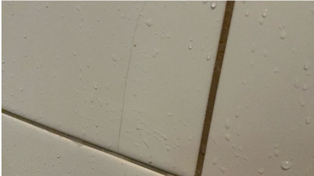
Tynt riss i flis dusjsone