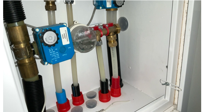
Fordelerskap i bod. Med stoppekraner