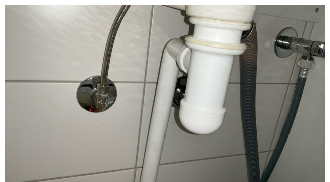
Avløp servant bad