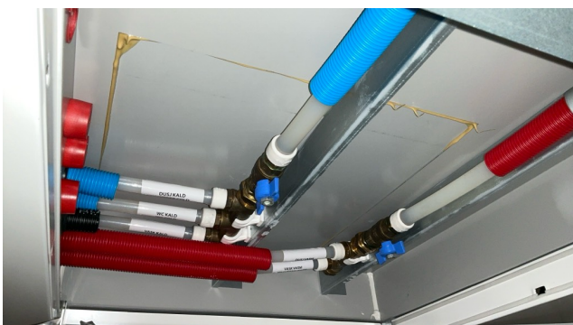
Fordelerskap i bad. Tilkomst via luke i tak bad