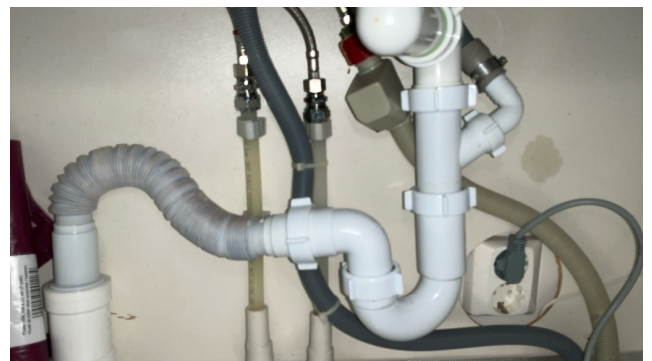
Avløp vask kjøkken

Avløpsrør av plast. Synlig i servantskap bad og i kjøkkenskap med vask.